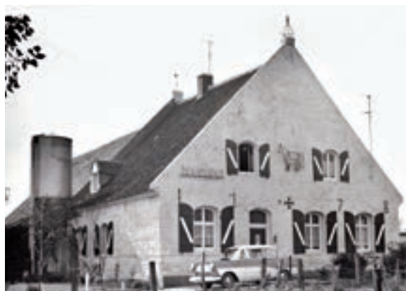
Hovershof (begin jaren zestig).

Hoogwaterhuis Schuur met uitgebouwd kapelletje. In Hasselt aan de Ebberstraat verrees omstreeks 1700 op een kleine heuvel een schuur met aan de noordzijde een Annakapelletje, waarvan de puntgevel een ijzeren kruis draagt. Waarschijn-