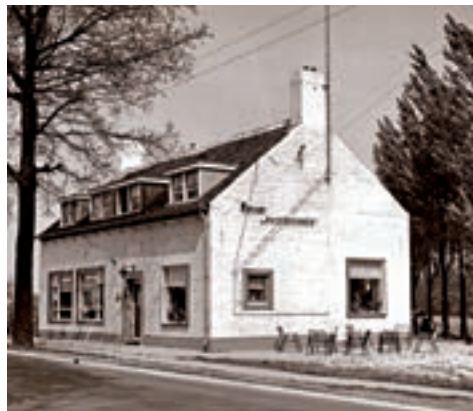
Pension De Ravenvennen (1960).

breken, waarop het besluit viel naast de kerk een nieuwe pastorie te bouwen. Die plannen gingen uiteindelijk niet door, omdat het kerkbestuur na de dood van de vroedvrouw in Lomm haar woning aan het Antoniusplein kon kopen. Deze woning uit de jaren vijftig deed hierna dienst als pastorie. Dat bleef zo tot september 2008. Vanaf die tijd is er één pastorie in Velden voor de drie parochies. Zie: Parochie.