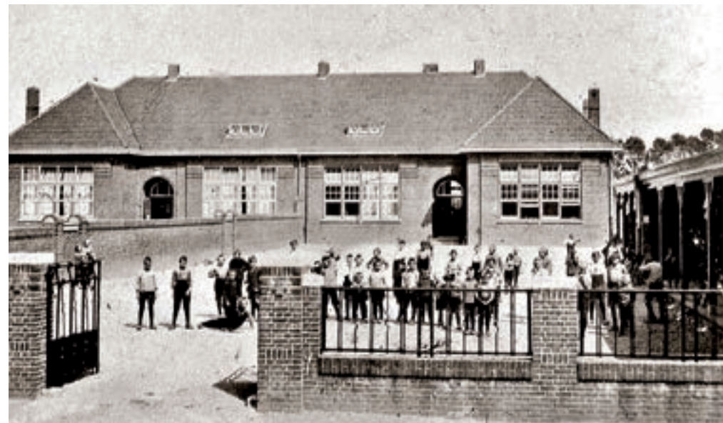
De Aloysiusschool (1928).