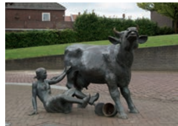
Koe met vallend melkmeisje.

Koe met vallend melkmeisje Beeldengroep . Op de Markt voor de kerk werd op 6 september 1980 een beeld onthuld van de Reuverse kunstenaar Nicolas van Ronkenstein (Joep Nicolas). Het beeld bestaat uit een koe, die met de staart een melkmeisje van haar krukje zwiëpt. Nicolas gebruikt de koe als symbool voor de agrarische achtergrond van de dorpskern. Het beeld stond op de plek waar zich vroeger zuivelfabriek Sint-Isidorus bevond. Het kunstwerk is 1,10 meter hoog en weegt 330 kilo. In 2005 werd het beeld in verband met de reconstructie van het marktplein vijftig meter verplaatst en vanaf 2007 staat het op de hoek Markt-Scholtisstraat. Zie: Melkfabrieken; Velden vitaal.