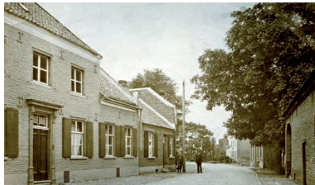
De Schans omstreeks 1900.

Ruiten Troef Inzamelactie. Omdat de glas-inloodramen van de Sint Petrus- en Pauluskerk in verval waren geraakt en er dringend isolatie nodig was, werd eind 1981 in Arcen een grote inzamelactie gehouden onder de naam 'Ruiten Troef'. Het ging om een bedrag van 50.000 gulden. Sponsors konden de kerkvensters voor een vastgesteld bedrag adopteren, de plaatselijke middenstand organiseerde een loterij en een aspergemarkt, en de harmonie gaf een speciaal concert. Op 26 juni 1983 nam pastoor Martens een cheque in ontvangst om alle ramen te laten herstellen en te isoleren. Bovendien kon men van het resterende bedrag de verwarming in de kerk vervangen. Zie: Aspergemarkt; Klokken Drie; Koninklijke Harmonie van Arcen; Sint-Petrus en Pauluskerk .