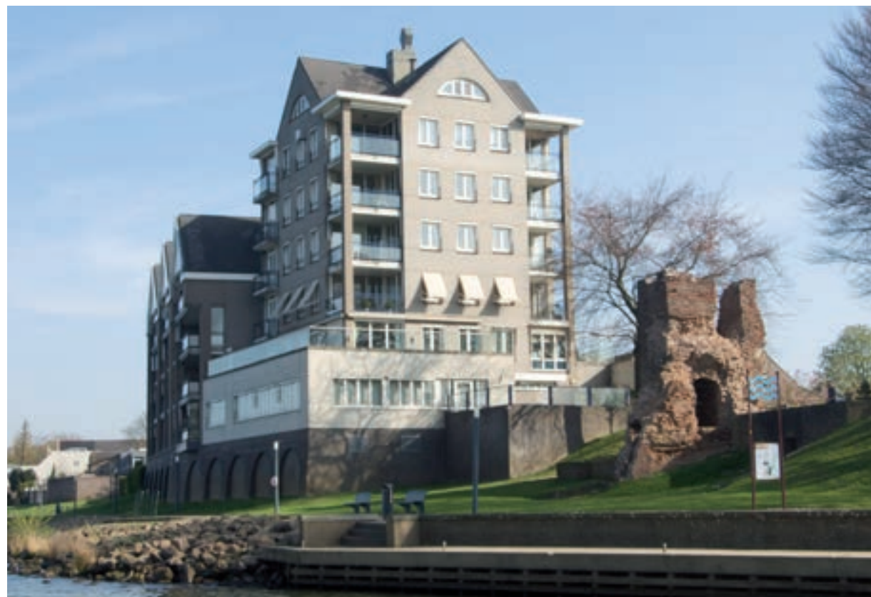
La Tour Meuse.

Valckx, Stan Voetballer. Stan Valckx werd op 20 oktober 1963 in Arcen geboren. Hij bezocht de middelbare school in Venlo. Stan Valckx voetbalde aanvankelijk bij DEV-Arcen en maakte op zeventienjarige leeftijd als amateur de overstap naar v v v Venlo. In het seizoen 1983-1984 werd hij (semi)profvoetballer. In totaal speelde hij in Venlo vijf seizoenen, waarvan drie in de Nederlandse Eredivisie. In 1988 verkaste Valckx naar PSV Eindhoven, waar hij tot in 1992 speelde. Hierna tekende de Arcenaar een contract bij Sporting Lissabon, waar hij twee seizoenen voetbalde. Tijdens zijn derde seizoen in Portugal keerde Valckx terug naar Eindhoven waar hij tot aan het einde van zijn profcarrière in 2000 speelde. In zijn laatste twee seizoenen kwam hij echter nog maar drie keer aan spelen toe. In zijn gehele loopbaan speelde Valckx 435 wedstrijden in nationale competities, waarin hij dertig keer tot scoren kwam. Valckx speelde twintig interlands voor het Nederlands elftal. Zijn debuut maakte hij op 26 september 1990, onder trainer Rinus Michels, tegen Italië. Met het nationale team speelde hij onder meer op het wereldkampioenschap voetbal in de Verenigde Staten. Van 2004 tot 2008 was Stan Valckx technisch manager bij PSV. Hier vertrok hij na een conflict. In 2009 was de Arcenaar technisch directeur bij de Chinese club Shanghai Shenhua. Hierna vervulde hij diezelfde functie tot 2012 bij het Poolse Wisla Kraków. Zie: DEV-Arcen.