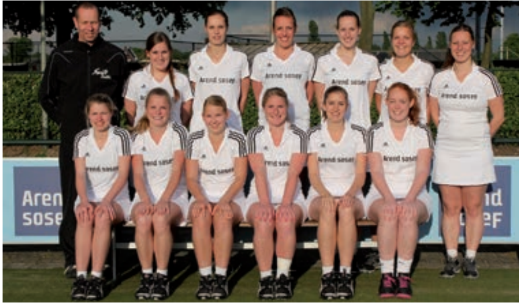
Swift 1 (seizoen 2013-2014).

rij is vijftig meter lang, met het woongedeelte aan de westzijde. Bij de boerderij horen van oudsher een grote boomgaard, weiden en enkele hectare akkerland. Zie: Stepkensbeek.