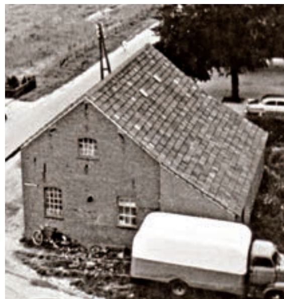
Coöperatieve graanmolen (1961).

Molens In Lomm hebben in de loop der jaren meerdere molens gestaan. Zo lag er mogelijk vanaf de tweede helft van de vijftiende eeuw een watermolen. Bij opgravingen kwamen muurresten en fundamenten van een tras- of tredmolen te voorschijn met een diameter van circa twintig meter. De molen lag op een stroomrug van de Maas, in de lus van de Haagbeek. Bij de molen