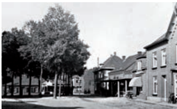
Markt Velden (1940).