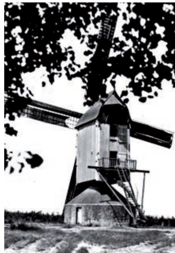
De Heimeule omstreeks 1930.

Molens In de loop der tijd stonden in Velden meerdere molens. De oudst bekende molen stond op de Bong of in het Bongerveld. Uit een archiefstuk blijkt dat deze molen omstreeks 1508 is afgebroken. In 1736 stond er een windmolen op een zandduin in Hasselderheide. Dit was een standaardmolen die kon rondraaien, zodat de wieken steeds recht tegen de wind stonden. Wanneer men de molen bouwde, is niet bekend. Wel is zeker dat men de molen in 1797 door een nieuwe verving.