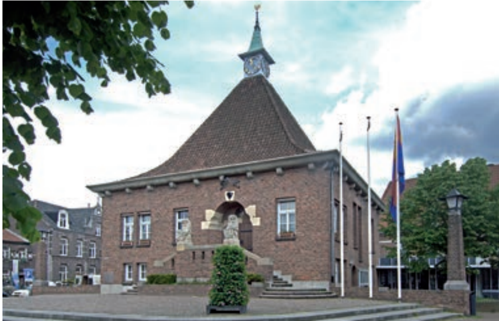
Het voormalige raadhuis.