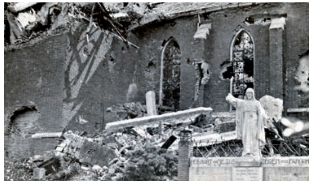
De zwaar beschadigde Veldense kerk.