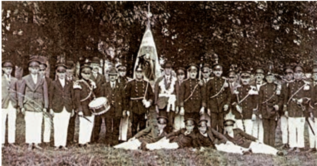
Schutterij Sint-Andreas (1926).

derij, waarvoor het oude kapelletje moest wijken. In dat kapelletje stond een mogelijk zeventiende eeuws houten Annabeeldje. Dit beeld kwam hierna in de nis van de frontgevel van het nieuwe pand 'Huben' te staan. Omdat de condities van het houten beeld verslechterden, werd dit na verloop van tijd door een gelijkvormig betonnen beeld vervangen. In de plaats van de afgebroken kapel bij 'Huben' is omstreeks 1905 een nieuw kapelletje gebouwd onder een lindeboom bij de splitsing Oude Heerweg-Kloosterstraat. Deze kapel was toegewijd aan het H. Hart van Jezus en maakte vele jaren onderdeel uit van de sacramentsprocessie. Rond 1965 is ook deze kapel afgebroken. Ditmaal om de weg te verbreden. Zie: Hubenhof.