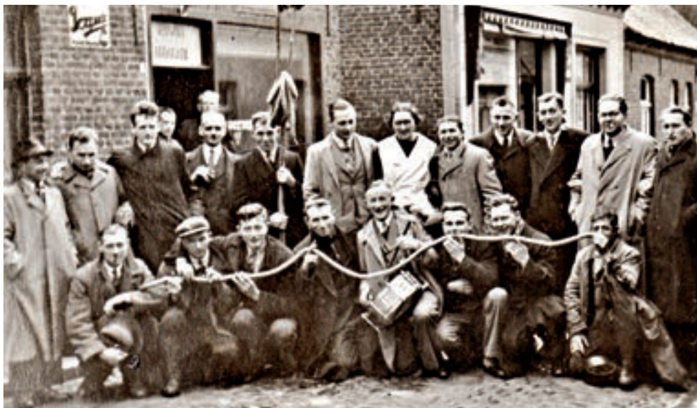
Sint-Sebastianusgilde (± 1950).

Arcense schutters een uitnodiging om in Geldern te komen schieten. Het oudste gildezilver draagt het jaartal 1734. Uit bewaard gebleven statuten uit 1681 blijkt dat de 'hoofelijcke Broederschap onder de titel ende voorspraek van den St. Sebastianus, martelaar, voor hondert ende meerdere jaeren' werd opgericht. De gildebroeders baden en hielpen elkaar bij ziektes en ongevallen. In de Arcense kerk had het gilde een eigen altaar. Eeuwenlang ontving het gilde geld uit contributies en het innen van boetes bij de leden. Het Sint-Sebastianusgilde had van oorsprong een religieus karakter. De broeders waren verplicht de Heilige Mis bij te wonen en kregen een boete ingeval ze vloekten of onmatig dronken. Gaandeweg wijzigden de statuten en nam het 'gezellig samenzijn' een belangrijkere plaats in. Het lidmaatschap is er voor gehuwde of duurzaam samenwonende mannen, weduwnaars of vrijgezellen boven de dertig jaar en woonachtig in Arcen. Het gilde werkt van oudsher mee aan een fatsoenlijke begrafenis van overleden leden door de uitkering van een geldbedrag. Het bestuur bestaat uit vijf gildemeesters aangevuld met elf officieren. De gildemeesters worden uit de leden voor vijf jaar gekozen. De officiersfuncties worden per opbod verkocht en gelden voor het leven. Het bieden geschiedt in liters bier, in veelvoud van 25 liter en tegen een prijs van een euro per liter. Het gilde telt in 2013 circa 460 leden. Hoogtepunten zijn het jaarlijkse naamfeest van de