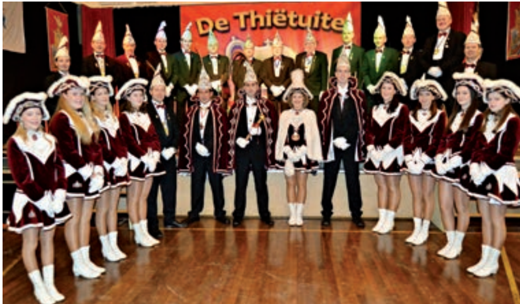
De Thiëtuite (2012).