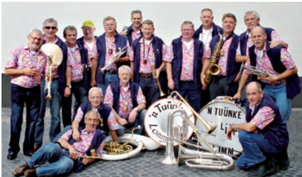
'n Tuünke Liëger (2008).

ment groeide uit tot de eerste avond waarop iedereen verkleed was. Hele straten en vriendengroepen verschenen uitgedost in de mooiste pakjes. Vanaf 1988 waren ook ongetrouwden welkom en veranderde de naam in Thiëtuitebal. In 1975 namen de Thiëtuite voor het eerst deel aan de sleuteloverdracht op het raadhuis van Arcen op zaterdagochtend voor de vastenaovend. Ook ging