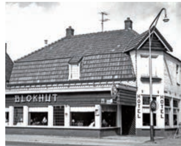
De Blokhut omstreeks 1965.

Blaeckhof, De Woonzorgcomplex. Op 27 april 1988 opende Woningstichting Arcen en Velden op de hoek Kloosterstraat-Veerweg een woonzorgcomplex met veertien appartementen en een ontmoetingsruimte. Na de totstandkoming van De