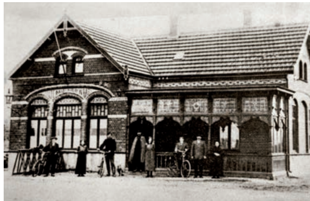
Café/tramhalte in Hasselt.

er tot 1920 zelfgebrouwen bier tapte. Aan de westzijde van de markt bevond zich zaal Litjens van de familie Litjens-Smits, die naast een café een aannemersbedrijf had. Na de Tweede Wereldoorlog