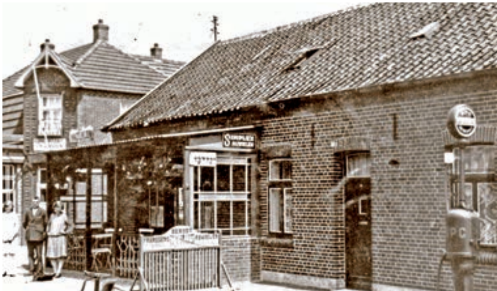
Café Bouten, circa 1930.

Wach Effe Joekskapel. Wach Effe werd opgericht op 1 mei 1992. De kapel was een voortzetting van de Trienkeskapel. Van de leden van het eerste uur, was er slechts één die een instrument kon bespelen.