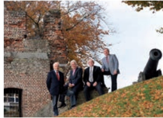
College van B&W (2009).