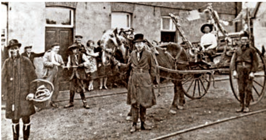
Gekke Maondaag (1926).