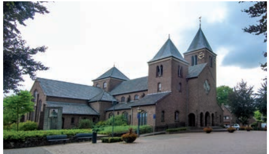
Sint-Petrus en Pauluskerk.

aan de kant van de Kerkstraat is één verdieping lager en heeft een hoogte van 20 meter. Beide torens zijn gedekt met leien. Aan het zuidertransept is de sacristie gebouwd, evenwijdig aan de lengteas van het schip. Beide torens zijn voorzien van een uitbouw met een lessenaarsdak, waarin een doopkapel en een Mariakapel zijn ondergebracht. Het interessante aan de kerk is de compositie van schijnbaar losse elementen van verschillende hoogten, volumes en dakvormen. De afwisseling van lessenaarsdaken, zadeldaken, geknikte dakhellingen, ingesnoerde spitsen en tentdaken