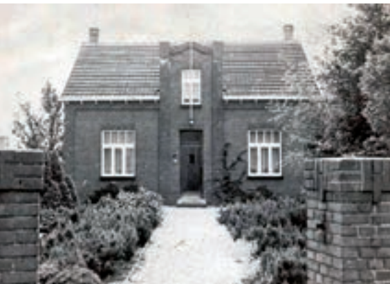
Pastorie, circa 1960.