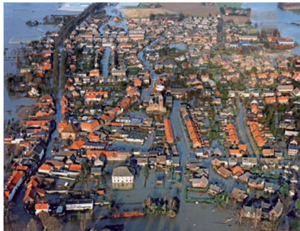
Hoogwater in Arcen (1993).

samengaan met Horst aan de Maas, terwijl de gemeenteraden van Bergen, Gennep, Mook en Middelaar ook de deur voor een fusie met Arcen en Velden hadden opengezet. Een opsplitsing van de kernen Arcen, Lomm en Velden was voor de lokale politiek geen optie. Per 1 januari 2010 was de herindeling een feit en hield de zelfstandige gemeente Arcen en Velden op te bestaan. Venlo werd 42 vierkante kilometer groter en kreeg er 9605 inwoners bij. Daarmee telde de nieuwe gemeente Venlo meer dan 100 000 mensen op ruim 128 vierkante kilometer. Zie: Dorpsraden; Franse tijd; Gemeente; Grenscorrecties; Politiek.