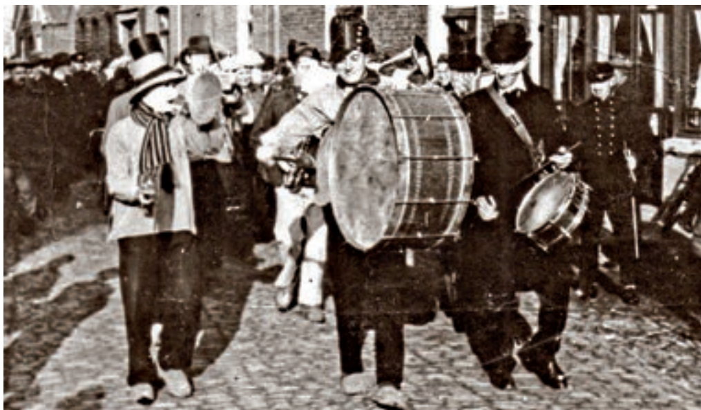
Klein Vastenaovend 1938.