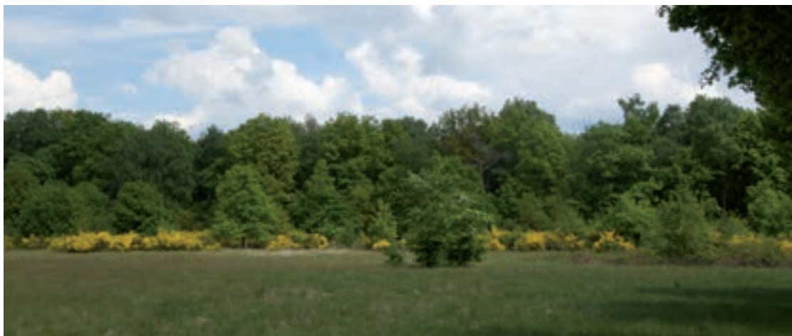
Exterveld (Lomm); Landgoed Arcen (Arcen); Maasduinen, De (Arcen-Lomm-Velden); Vlees, De.

Latbeek Waterloop . De Latbeek, ook wel Lot- en Molenbeek genoemd, ontspringt in natuurgebied het Zwart Water. De beek is feitelijk een kanaal dat rond 1900 werd gegraven voor de ontwatering van de Bong, Schandelo en 't Schandels Broek. De Latbeek loopt door het Diepbroek en het Schaapsbroek en voert water uit de Venkoelen in noordelijke richting af. In de beek zijn stuwen geplaatst om het grondwaterpeil te verbeteren. De naam van de beek is afgeleid van waterlaat. De Latbeek mondt bij Hasselt uit in de Maas. Zie: Schaapsbroek, Het; Zwart Water.