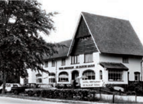
De Blauwe Donau.

Adventure World of Taurus Partycentrum. In 1978 bouwde horeca-exploitant Wout Heijmans hotel-restaurant In de Dennen aan de Rijksweg om tot een bowlingcentrum. Het pand, een voormalige villa, lag toen al een tijd leeg en had vanaf 1957 dienst gedaan als hotel-café-restaurant met achtereenvolgens als namen: In de Dennen, De Blauwe Donau en Het Wapen van Zeeland. Daarna werd het weer omgedoopt tot In de Dennen. Achter het pand verrees een hal met tien banen. In het voorste deel kwam een eetgelegenheid en een vergader- en biljartzaal. Het centrum kreeg als naam Taurus. In 1989 breidde Taurus uit met een Tropical Partycentrum. Vijf jaar later vond een ingrijpende verbouwing en uitbreiding plaats en verrees Europa's grootste laserarena in een drie verdiepingen tellende Indiana Jones-achtige omgeving. In 2003 werd de Laserarena verbouwd en omgetoverd tot een wereld vol buitenaardse wezens. In 2013 volgde opnieuw een uitbreiding, waarbij het totale complex uitkwam op achttien duizend vierkante meter.