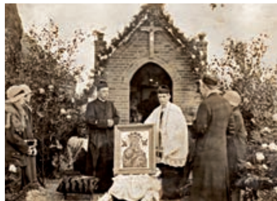
Kapel van Onze Lieve Vrouw (1929).

gedekte kapel. Het oude schilderij verving men door een afbeelding van Onze Lieve Vrouw van Altijddurende Bijstand. De familie droeg de nieuwe kapel in 1930 over aan de kerk. Van 1930 tot 1970 trok jaarlijks in oktober een processie naar de kapel. In 1992-1993 werd de kapel door een drietal Veldenaren in oude luister hersteld. Voor het onderhoud zorgen nu buurtbewoners en het kerkbestuur in samenwerking met de Stichting Veldkapellen en Wegkruisen. Literatuur: Jacques Theelen, Veldkapellen en Wegkruisen in Velden, Arcen en Lomm (Zaltbommel 1984).