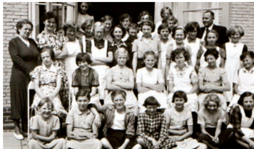
Streekhuishoudschool omstreeks 1951.

Streekhuishoudschool In 1957 startte in Lomm een 'Huishoudschool ten plattelande', ook wel Landbouwhuishoudschool genoemd. De komst van de school was een gevolg van een verlenging van de leerplicht. Doordat de zevende en de acht-