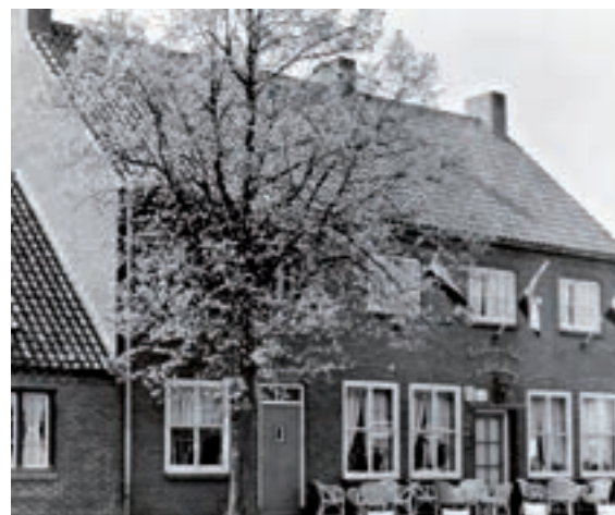
De Witte Berg (1961).