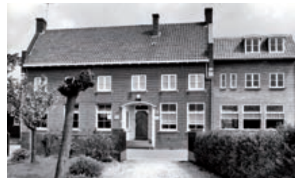
Café Rayer (1968).