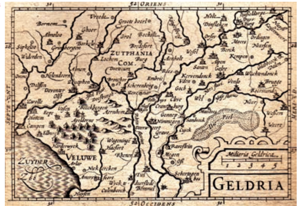
Gelder omstreeks 1635.