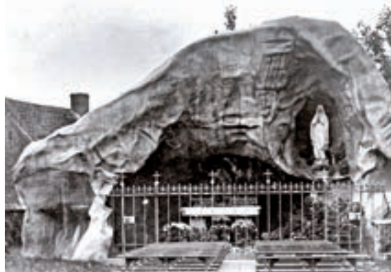
De Lourdesgrot (1938).

was mede-oprichter van de Veldense tennisclub en maakte vele malen deel uit van verschillende jubileumcommissies. Theo Lommen overleed op 1 juli 2001. In 1988 werden de voetbalvelden van IVO omgedoopt tot Theo Lommen Sportpark. Zie: IVO; Theo Lommen Sportpark; Rabobank (Arcen-Lomm-Velden); T C Velden; Wuilus, De.