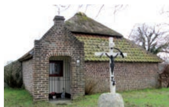
Sint-Annakapel te Hasselt.

gebouwd. Rond het midden van de negentiende eeuw was de middeleeuwse kerk te klein en in 1857-1858 volgde een uitbreiding met twee zijbeuken. Het priesterkoor en de toren bleven staan. De toren werd in de kerk ingebouwd, verhoogd en voorzien van een nieuwe spits. Tijdens de verbouwing vonden de diensten in een schoollokaal plaats. De vernieuwde kerk kon in 1858 in gebruik worden genomen. Doordat de bevolking toenam, was de kerk zeventig jaar later opnieuw te klein. Bovendien verkeerde ze in een slechte staat. Vandaar dat het besluit viel een nieuwe kerk te bouwen. Op 16 april 1933 werd de laatste Heilige Mis in de oude Sint-Andreaskerk opgedragen. De nieuwe, en vooral grotere kerk, verrees in 1933-1934 naar een ontwerp van de Venlose architect Jules Kayser. Het oude gebedshuis was 23 bij 14,5 meter, terwijl de nieuwe kerk een lengte van 45 en een breedte van 20 meter kreeg. Men heeft nog geprobeerd de toren en het priesterkoor te sparen,