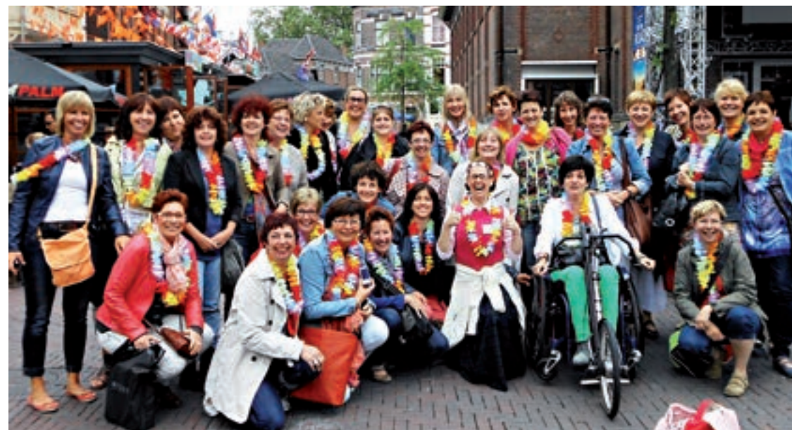
Vocalgroup Avolon (2012).