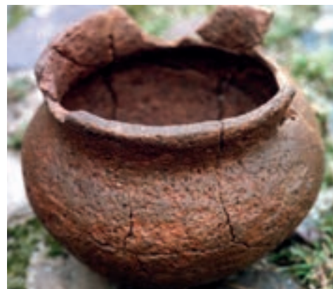
Urn uit de late bronstijd.

Archeologische vondsten In de voormalige gemeente Arcen en Velden bevinden zich ruim 180 archeologische vindplaatsen. Grofweg is er één vindplaats uit het midden-paleolithicum (oude steentijd), dateren 24 sites uit het mesolithicum (midden-steentijd), 37 uit het neolithicum (nieuwe steentijd), 6 uit de bronstijd, 19 uit de ijzertijd, 56 uit de Romeinse tijd en 21 uit de vroege middeleeuwen. De oudste vondsten – van steen en vuursteen – zijn uit het vroeg-mesolithicum. Neolithische en vooral mesolithische sites bevinden zich op de hoge en droge zandgebieden, later verschoof de bewoning naar het vruchtbare, vochtigere Maasterras. De oudste bewoners van de streek lieten resten van graven achter die waarschijnlijk uit het laatste deel van het stenen tijdperk stammen. Hun grafheuvels bevinden zich op De Hamert. Achter de Vorstweg in Velden vond men een vuursteenafslag en in Hanik en Schandelo werden stenen vuistbijlen gevonden. In Velden trof men in het Bongertveld grafvelden aan uit de late brons- en vroege ijzertijd met resten van urnen. Bij de Wittenberg, op de grens van Lomm met Velden, kwamen scherven van een