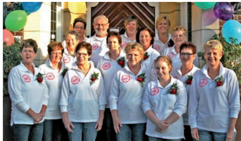
De Keiemegjes (2011).