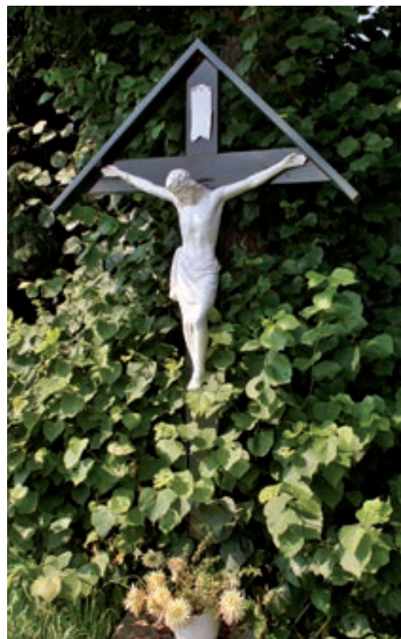
Wegkruis aan de Kruisweg.

via Domeinen. Voor de veerlieden en passagiers veranderde er al die tijd bijna niets. Met ingang van 1 januari 1984 kwamen de vijf veren tussen Kessel en Broekhuizen in handen van het Gewest Noord-Limburg. Lang was er tussen Arcen en Broekhuizen een gierpont in bedrijf, die op de stroming van de Maas naar de overkant 'gierde'. Na de kanalisatie van de Maas werkte dat niet meer. Vandaar dat de gierpont in 1939 werd vervangen door een gemotoriseerde kettingpont. Die pont wordt aangedreven door middel van schijven, waarover een ketting wordt geleid waaraan de pont zich van de ene naar de andere oever voorttrekt. Langs de andere kant van de pont loopt een stevige kabel om de richting te bepalen. Ook die kabel loopt van wal tot wal. Zowel de ketting als de kabel zijn op beide oevers stevig verankerd. Zie: Heerlijkheid (Arcen-Lomm-Velden); Maasovergangen (Arcen-Lomm-Velden); Paulus, familie (Velden). Literatuur: Ragdy van der Hoek & Ad Bogers, Aan de ketting over de Maas. Veerponten in Noord-Limburg (Venlo 1997).