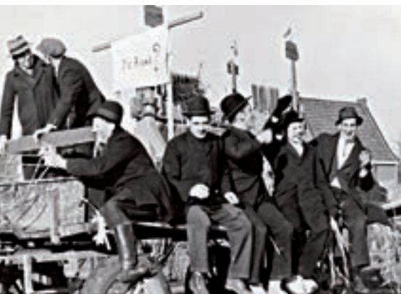
Gekke Maondaag in 1948.

broken. Telkens als er een woning vrijkwam, was die eenzelfde lot beschoren. Begin 2000 stonden er nog twee: nummer 34 (gesloopt in 2001) en nummer 20 (gesloopt in 2004). Op de vrijgekomen percelen realiseerde de Woningstichting Arcen en Velden nieuwbouw. Zie: Woningstichting Arcen en Velden (Arcen-Lomm-Velden).