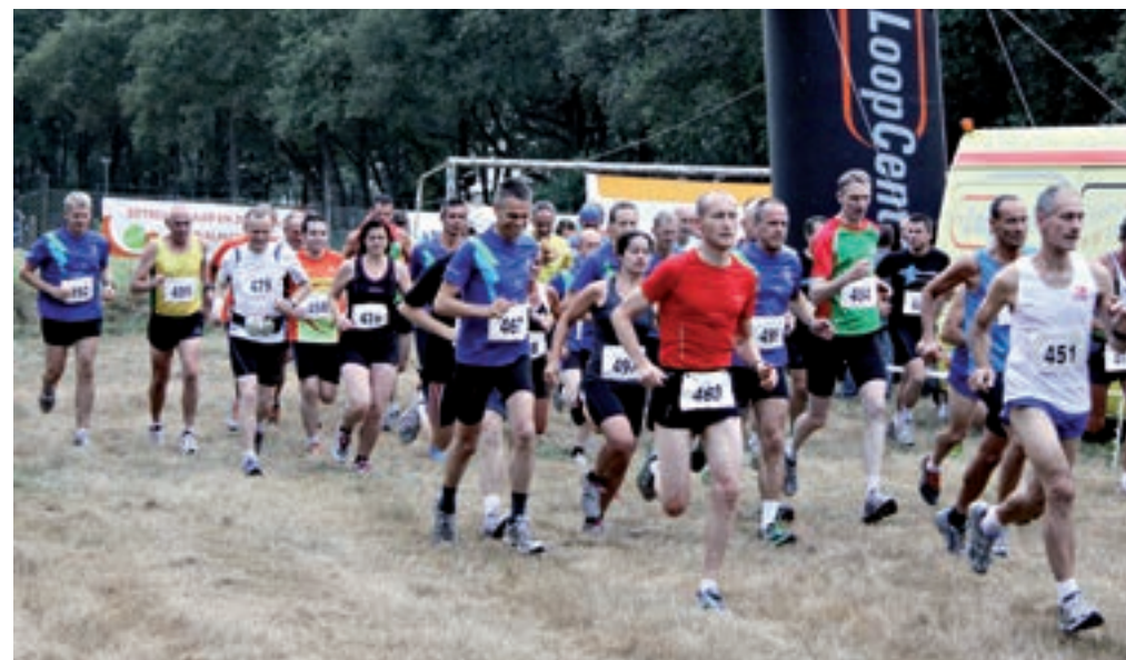
Loopgroep ALV (2012).

Kerspel Kerkelijke eenheid . De term heeft betrekking op het territorium van een parochie of kerkelijke gemeente. Vanaf de vijftiende eeuw tot ongeveer 1700 worden Arcen, Lomm en Velden aangeduid als kerspel. Hierna is sprake van twee gemeenten. Zie: Archief; Gemeente.