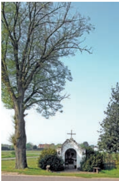
Mariakapel aan De Vilgert.