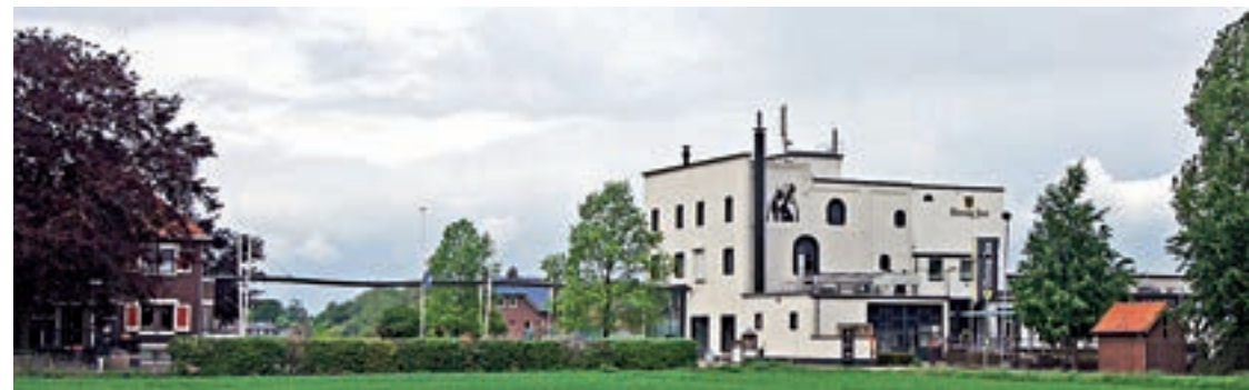
Brouwerij Hertog Jan.