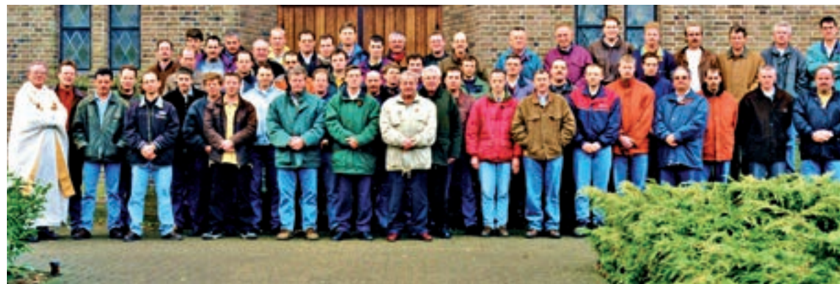
Vereniging van het Sint-Antoniusgilde.

141 Wiltland, Het Sportveldencomplex. Op 29 juli 1973 nam voetbalvereniging RKDSO aan de Bosbergstraat een sportveldencomplex in gebruik. Het complex herbergt drie voetbalvelden, kleedloka-