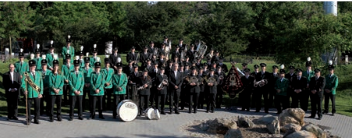
Fanfare Velden (2012).

sten waren bij café Bouten en in het Sint-Joseph-klooster. In zaal De Blokhut hielden de dames demonstraties. Buurtleidsters haalden de contributie bij de leden thuis op. Zij onderhielden de onderlinge contacten en gingen op ziekenbezoek. Tijdens lezingen stond vooral het katholieke gezin centraal. In 1965 ging de KAV verder onder de naam Katholieke Vrouwen Beweging en in 1970 als EVA, de afkorting van Een Vrije Avond. Begin jaren tachtig van de vorige eeuw telde EVA circa 160 leden. Uit EVA ontstonden een gymnastiekclub en een volksdansgroep. EVA organiseert culturele, informatieve en ontspanningsavonden. In 2013 telt de vereniging ongeveer 85 leden. Zie: Vrouwenbond.