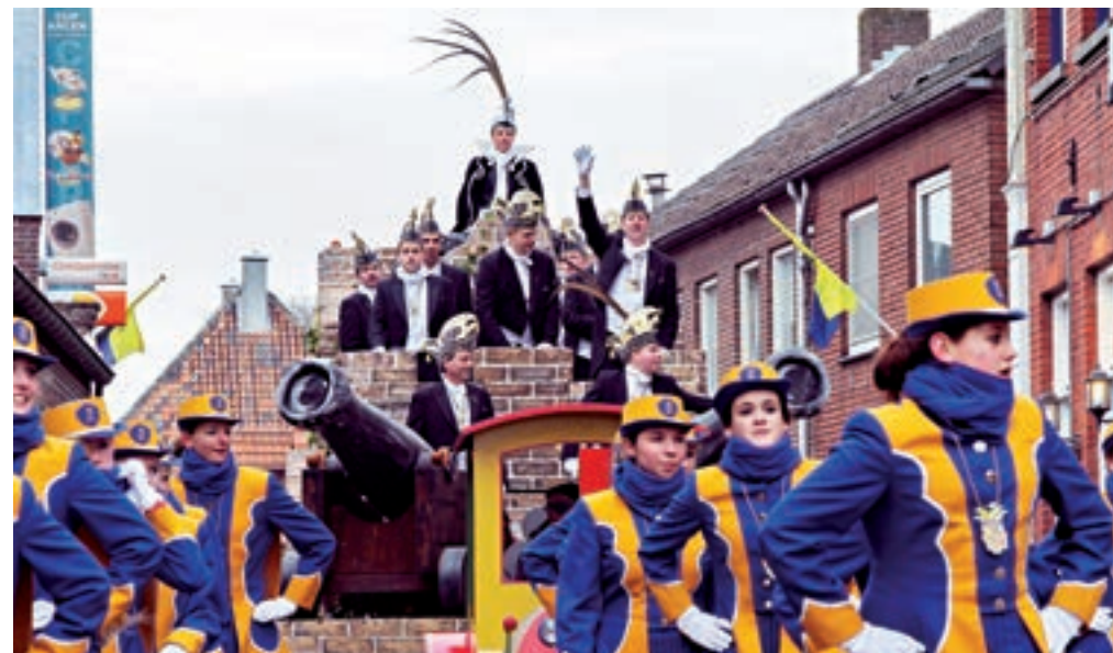
De Keieschiëters (2013).

Kei Good Joekskapel. Kei Good werd in 1981 opgericht door Wilfred Groot. De kapel speelde hoofdzakelijk in Arcen en trad enkele keren in Duitsland op. Kei Good speelde tijdens de vastenaovend op de Arcense sfeermarkten en tijdens joekskapellenfestivals. In 1986 stopte de kapel en stapte een aantal muzikanten over naar andere muziekgezelschappen. Zie: Vastenaovend.