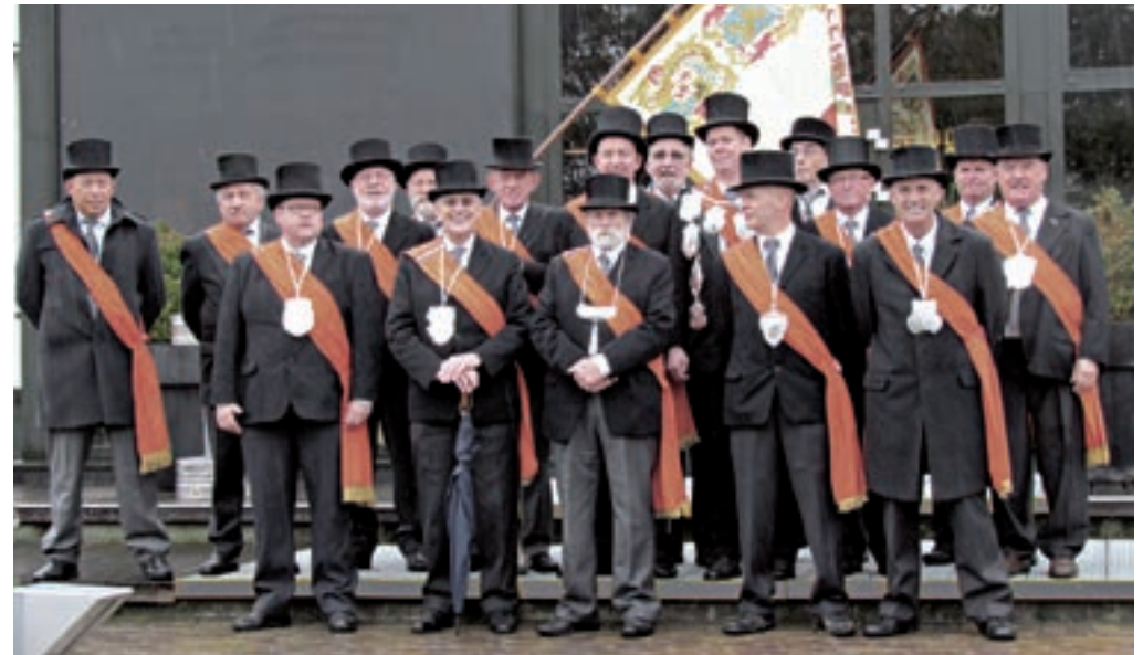
Sint-Petrus en Paulusgilde.