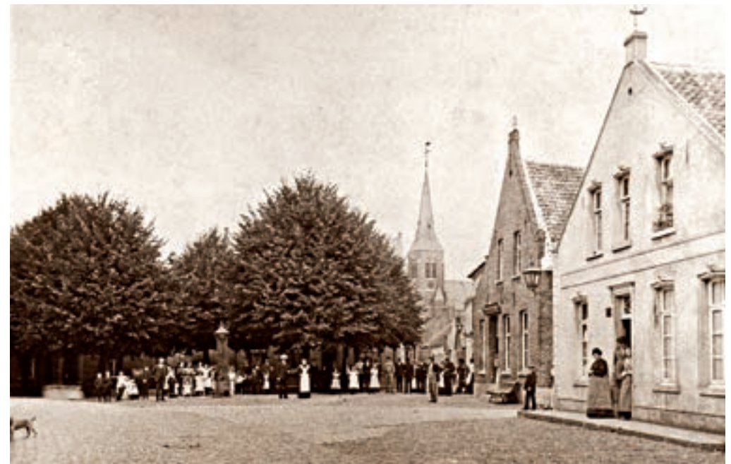
Marktplein omstreeks 1900.